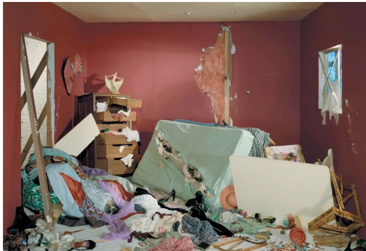
Jeff Wall fotografija Sugriautas kambarys (1978)