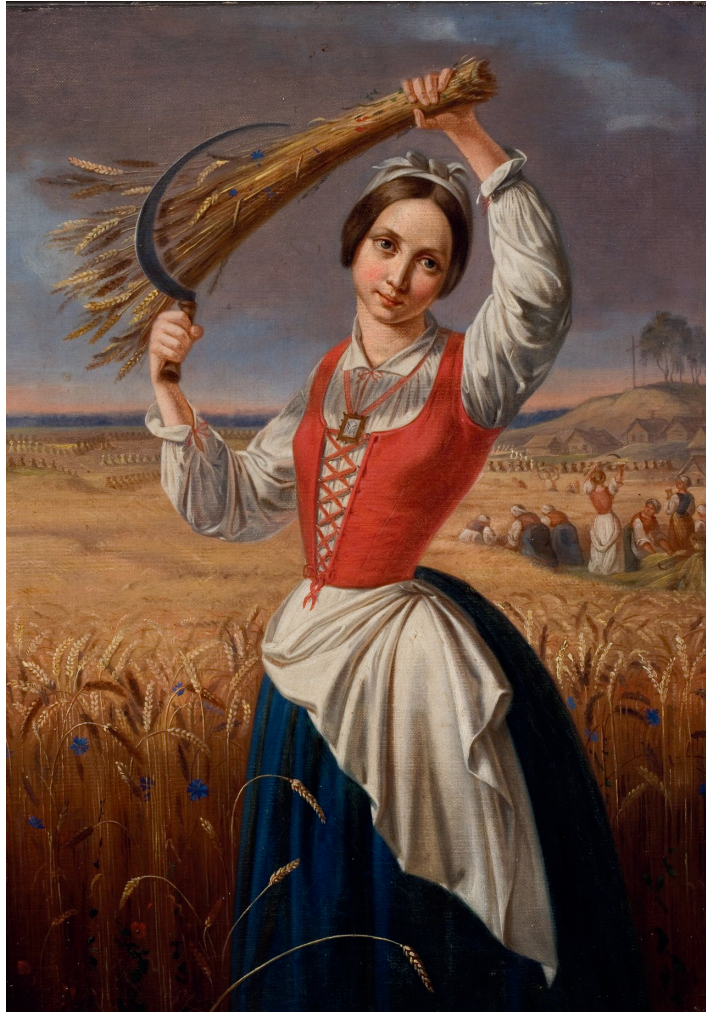
Pjovėja (1844), dail. Kanutas Ruseckas (1800–1860)